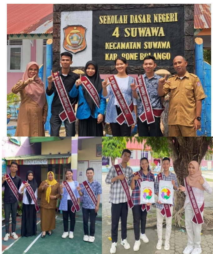
Gambar 2. Audiensi dengan SDN 4 Suwawa

Selain itu, tim juga melakukan audiensi dengan kepala sekolah SDN 04 Suwawa dan SDN 90 Sapatana. Audiensi tersebut bertujuan untuk mengupayakan agar permainan Raptagor dapat dijadikan sebagai salah satu media pembelajaran muatan lokal di sekolah. Pihak sekolah memberikan respons positif terhadap implementasi program dan menunjukkan ketertarikan untuk mengembangkan serta mencetak permainan ular tangga bahasa Gorontalo sebagai media pembelajaran di lingkungan sekolah.