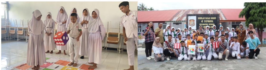
Gambar 3. Proses Pembelajaran Bahasa Daerah lewat Permainan Ular Tangga Bahasa

Program ini juga memberikan pengalaman belajar yang berbeda dibandingkan pembelajaran konvensional di kelas. Anak-anak tidak hanya memperoleh pengetahuan mengenai bahasa Gorontalo, tetapi juga belajar mengenal adat istiadat, makanan khas, simbol budaya, serta identitas lokal Gorontalo melalui aktivitas permainan. Dengan demikian, Tas Jinjing Raptagor tidak hanya berfungsi sebagai media pembelajaran bahasa, tetapi juga menjadi sarana penguatan literasi budaya bagi anak-anak sekolah dasar.