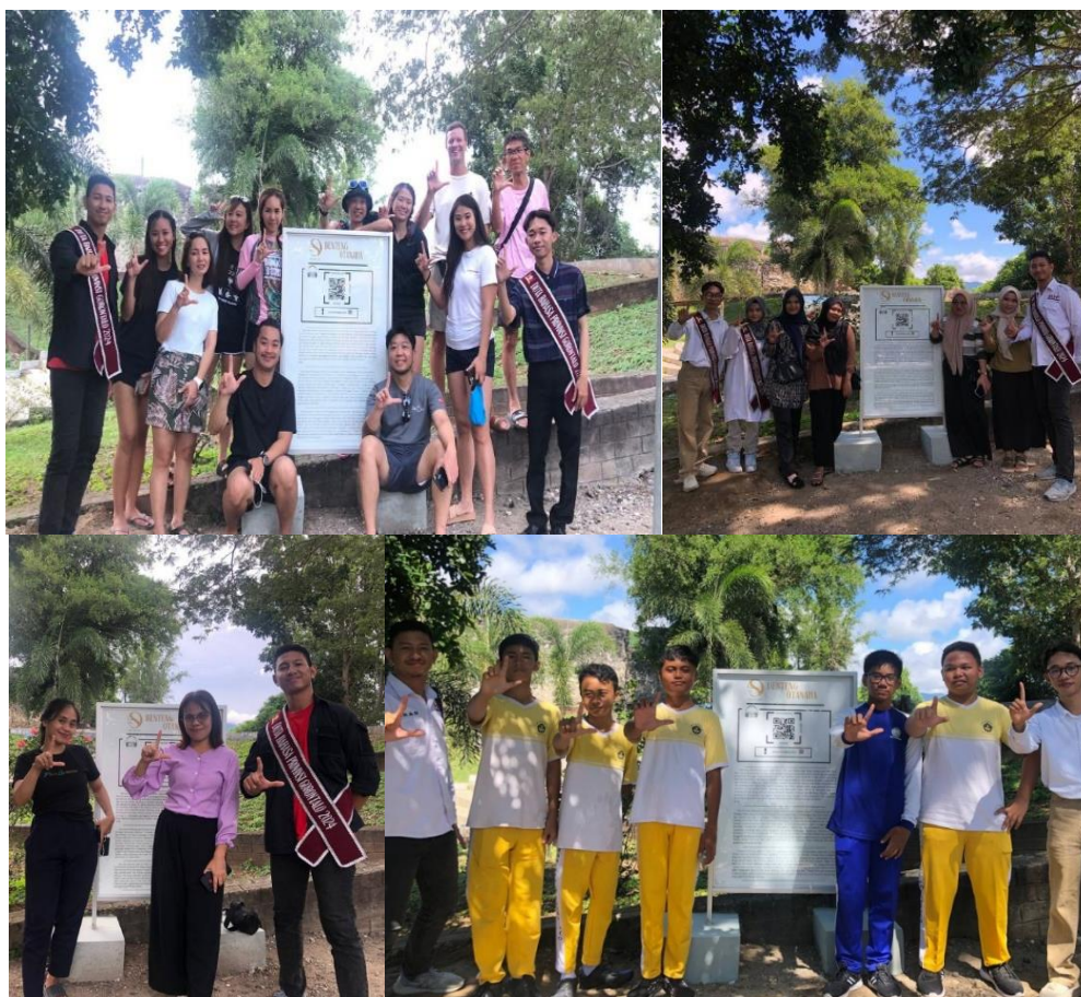
Gambar 2. Dokumentasi Tahap Pelaksanaan Program Swarago

Salah satu indikator keberhasilan program Swarago adalah terlaksananya publikasi program minimal sebanyak lima kali melalui media sosial, media komunikasi digital, dan kegiatan sosialisasi. Berdasarkan hasil pelaksanaan kegiatan, indikator tersebut berhasil dicapai bahkan melampaui target yang telah ditetapkan. Tim pelaksana berhasil melaksanakan tujuh kegiatan publikasi dan sosialisasi selama program berlangsung. Kegiatan publikasi dilakukan melalui media sosial Instagram Swarago_Official dan akun Duta Bahasa Provinsi Gorontalo, sedangkan publikasi digital dilakukan melalui media komunikasi daring seperti Safradio.id dan TribunGorontalo.com. Selain itu, sosialisasi secara langsung juga dilaksanakan di SMP Negeri 14 Kota Gorontalo, Dinas Kebudayaan, Pariwisata, dan Olahraga Kota Gorontalo, serta Badan Pelestarian Kebudayaan Wilayah XVII.