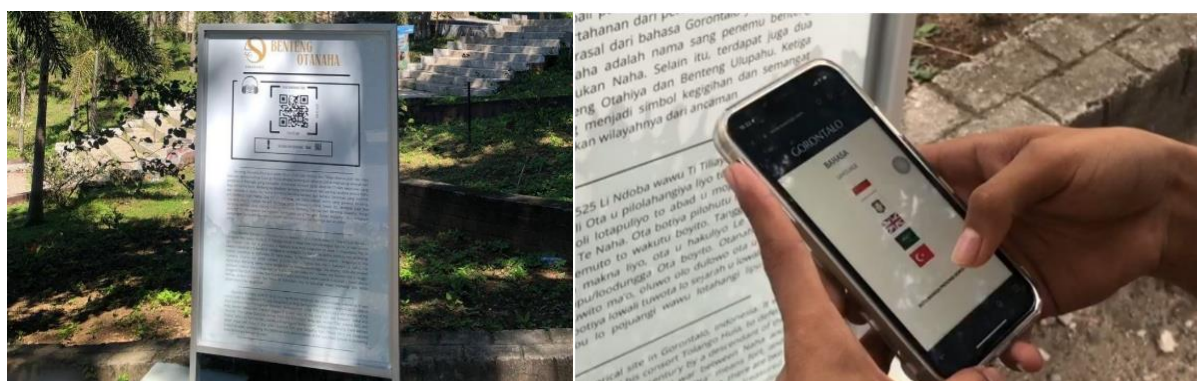
Gambar 4. Tampilan Situs Web Swarago

Selain itu, tingginya jumlah kunjungan situs web juga dipengaruhi oleh strategi publikasi digital yang dilakukan secara aktif melalui media sosial dan media komunikasi daring. Penggunaan teknologi berbasis kode batang mempermudah wisatawan dalam mengakses situs web secara langsung tanpa harus mencari informasi secara manual. Dengan demikian, integrasi antara teknologi digital dan wisata budaya terbukti mampu meningkatkan minat masyarakat dalam mengakses informasi sejarah dan budaya lokal.